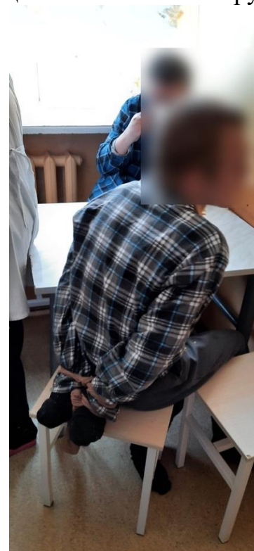
Молодой человек со связанными руками