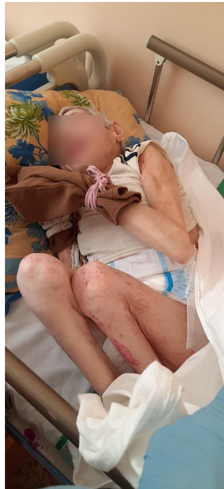
Женщина с завязанными руками