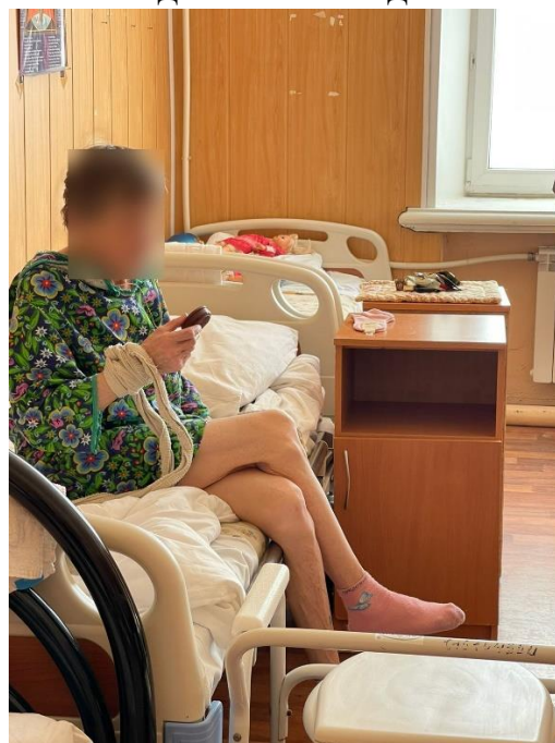
Женщина со связанными бинтами руками