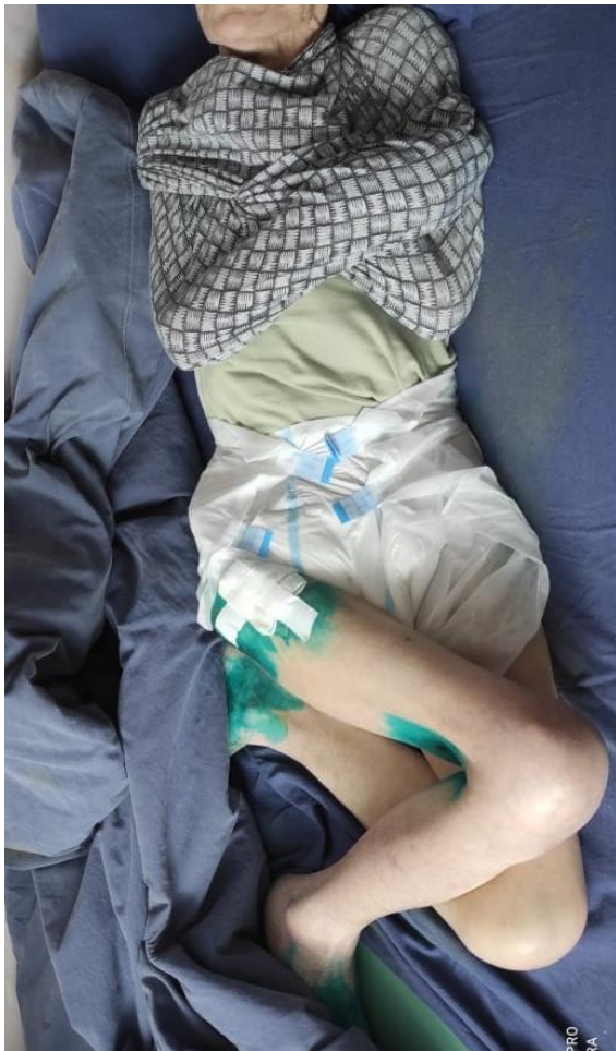
Женщина со связанными руками