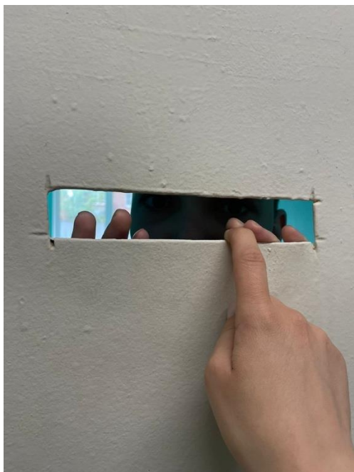
Гражданин проживает за запертой железной дверью в отделении милосердия