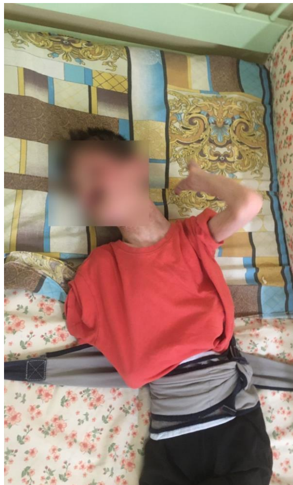
Девушка, привязанная к кровати