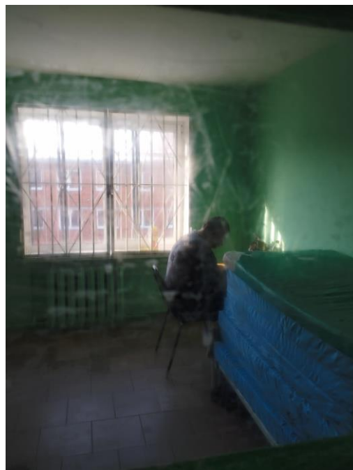
Гражданин проживает за запертой железной дверью в «наблюдательном отделении»