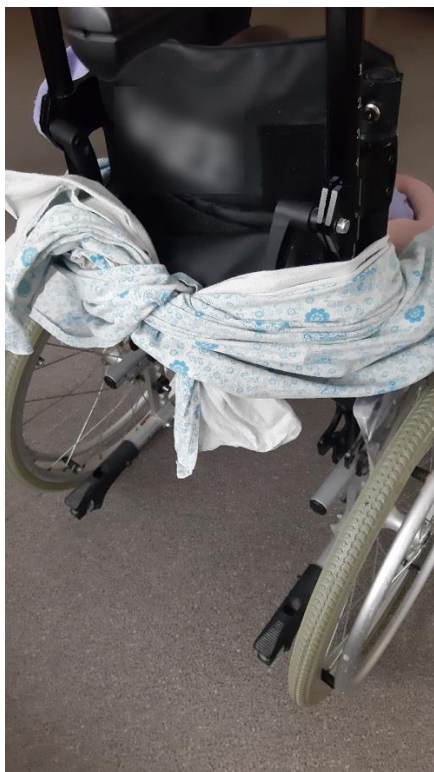
Молодой человек привязан простыней к коляске