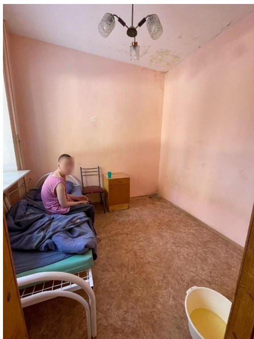
Молодой человек проживает в запертой комнате, для справления естественных нужд установлен таз